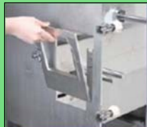
Como desmontar el marco de salida