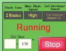
Pantalla de operación