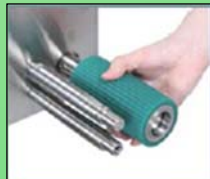
Como desmontar el rodillo