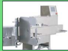
Se puede desmontar en este estado