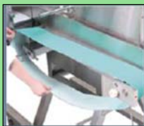
Como desmontar la cinta transportadora