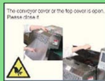
Pantalla de error