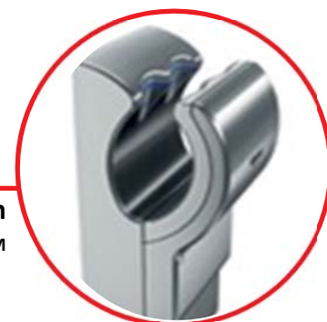
Secador Dyson Airblade™