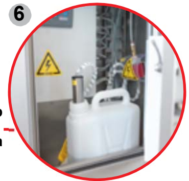
6 Contenedor de almacenamiento químico cerrado dentro la máquina