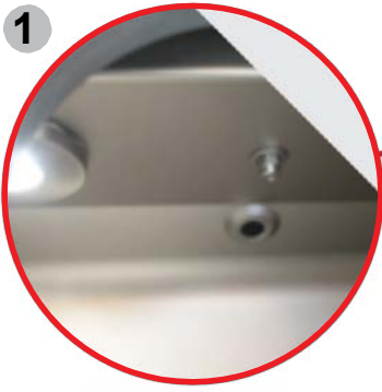
1 Cámara de esterilización iluminada