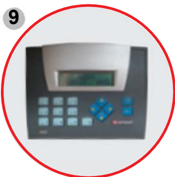
9 Operación totalmente automática con la opción de configurar 19 parámetros diferentes