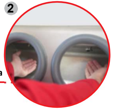
2 Protectores de goma