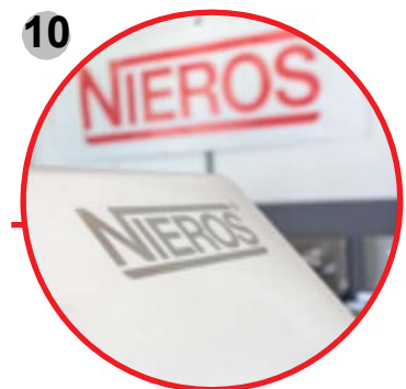
10 Diseño higiénico y pulido con chorro de arena