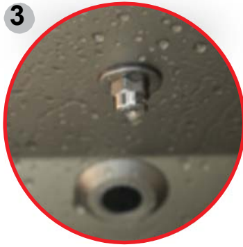
3 Aspersores del agente desinfectante de acero inoxidable