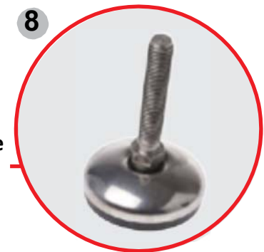
8 Altura ajustable