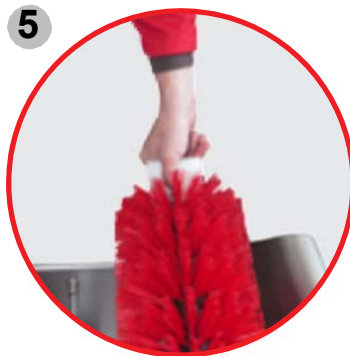
5 Cepillos fáciles de cambiar, no se necesitan herramientas extras