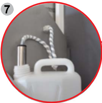
7 Dosificación automática del agente desinfectante