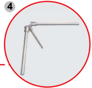
4 Torniquete de paso de control de acero inoxidable DIN 1.4301 (AISI 314)