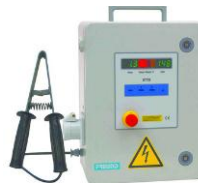
Estimulador sagnat STIM E-512